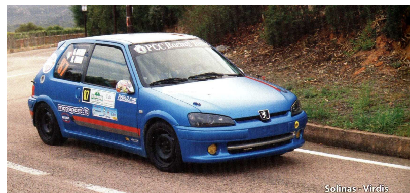
Solinas - Virdis