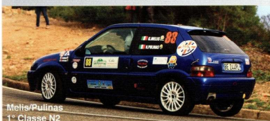
Melis/Pullinas 1° Classe N2