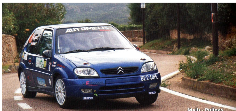
Melis - Pulinas