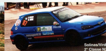
Solinas/Virdis 2° Classe N2

Tel: + 39 393 9510450 Fax: +39 041 5101131 Mail: info@mrcsport.it Web: www.mrcsport.it Addetto stampa: +39 328 6094275