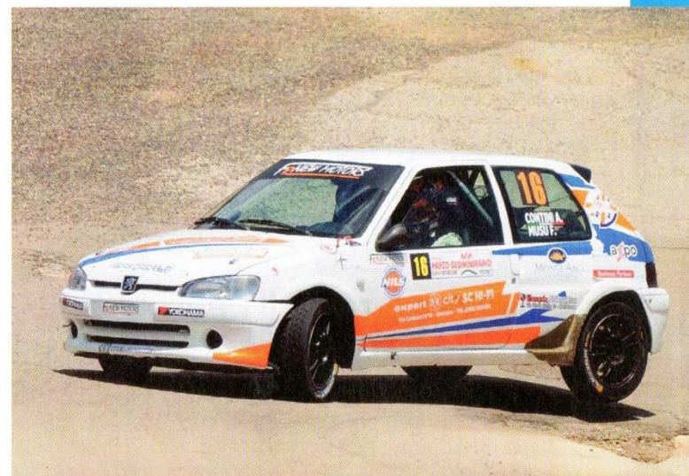
Fuori dal podio per poco più di mezzo minuto e primi di A6, Contini-Musu.